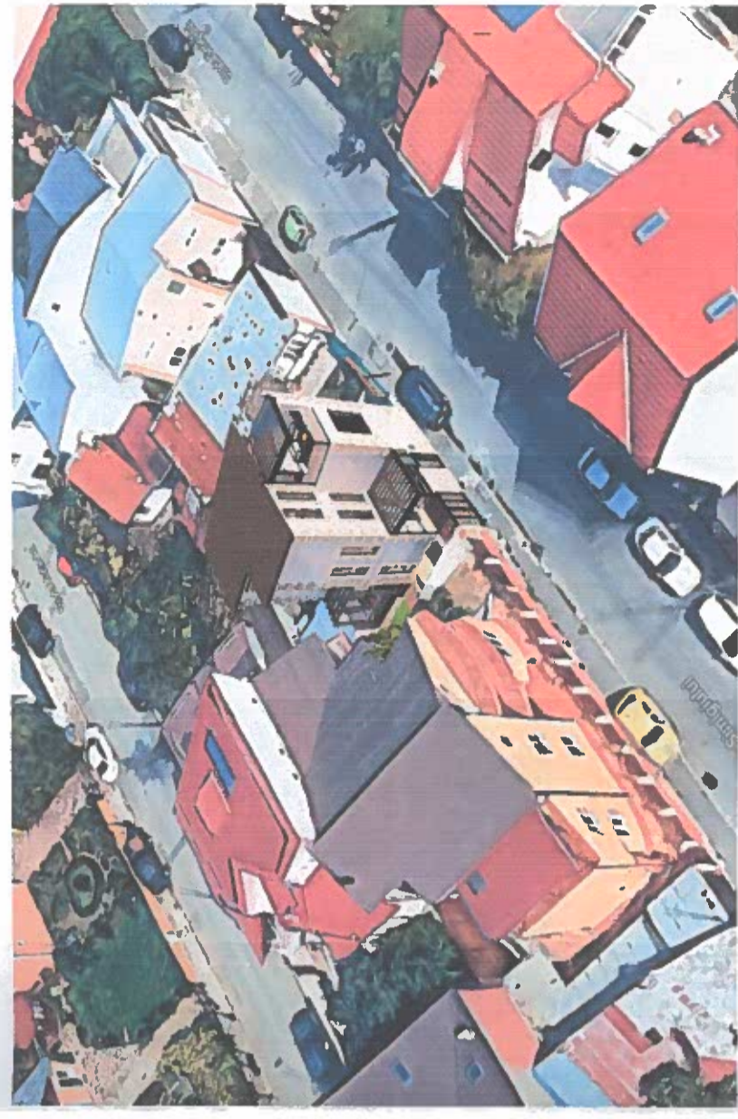
PERSPECTIVA FRONTALA - INCADRARE IN ZONA