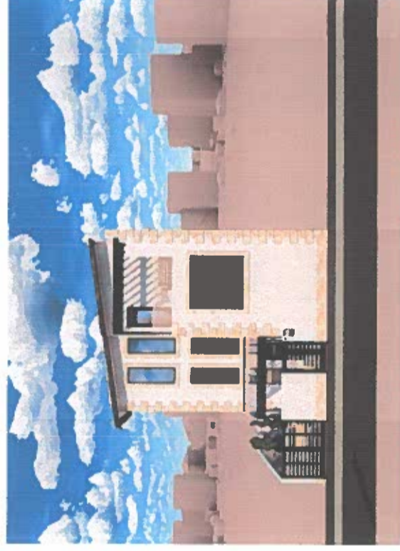
VEDERE FRONTALA - STRADA SIMIGIULUI